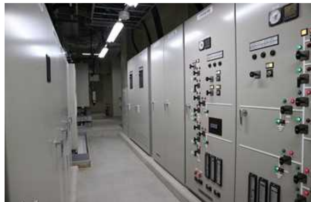
特別高圧受変電設備