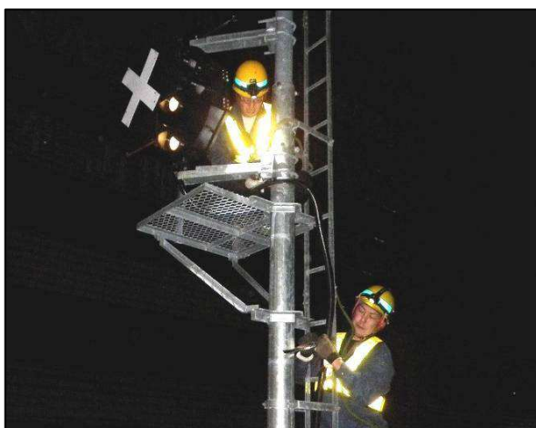
【信号設備】 信号機新設