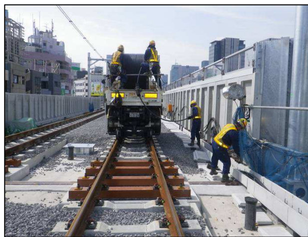
【送電線設備】 ケーブル新設