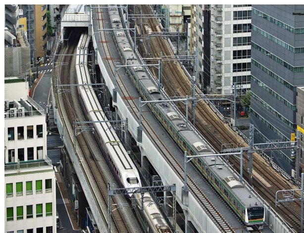
【完成】 東京～秋葉原間