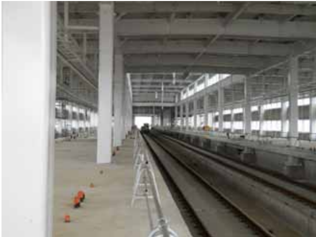
上越妙高駅ホーム上