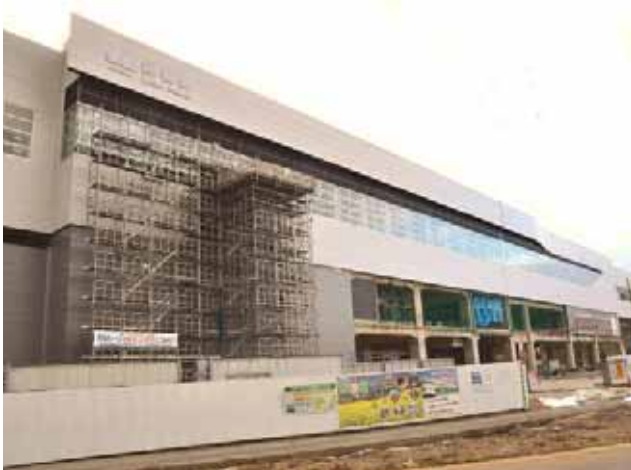
長野県飯山市 飯山駅