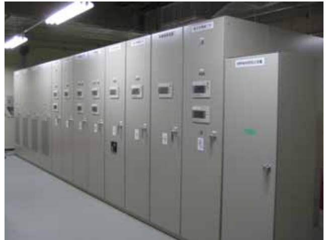
上越妙高駅配電室内高圧配電室