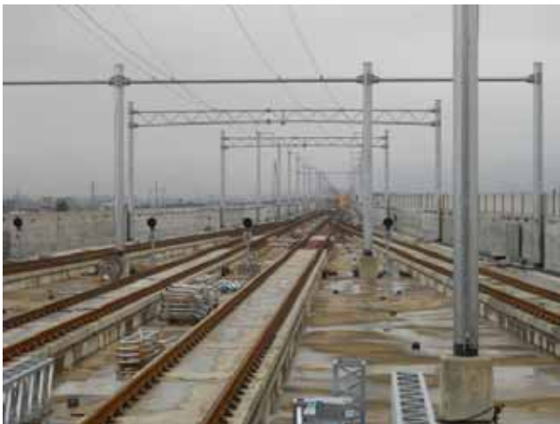
上越妙高駅ホーム上から長野方面