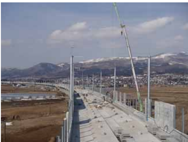
新函館付近から新函館駅(仮称)方面