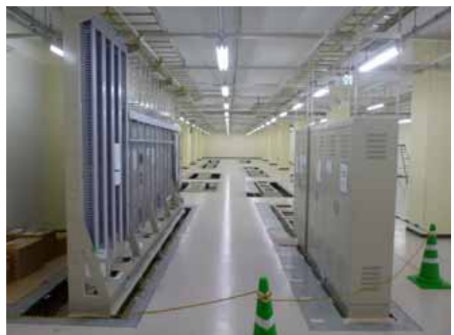
新函館通信機器室