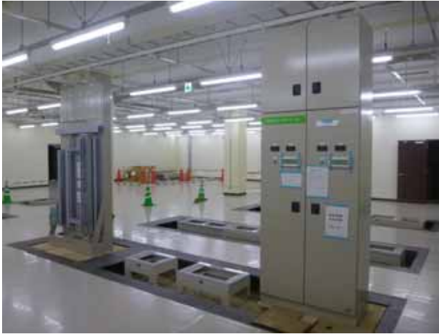
万太郎信通機器室