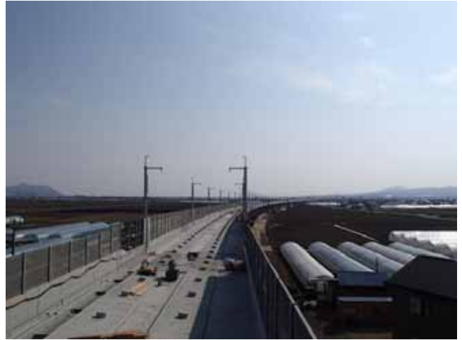
新函館付近から新木古内駅(仮称)方面