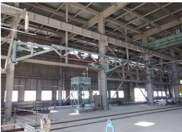
臨修庫内移動架線設備