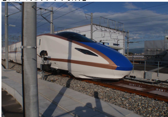
W7系車両 構内走行試験中