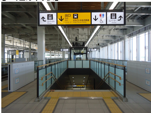
上越妙高駅ホーム