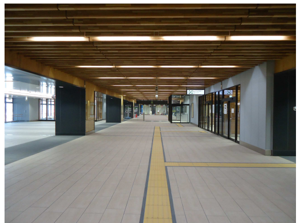
上越妙高駅コンコース