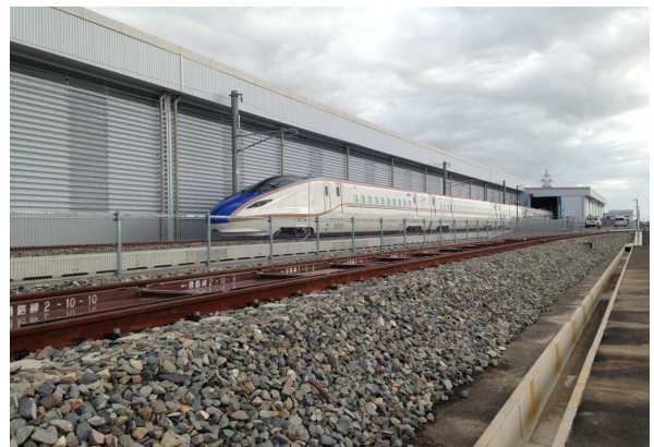
W7系車両 構内走行試験中