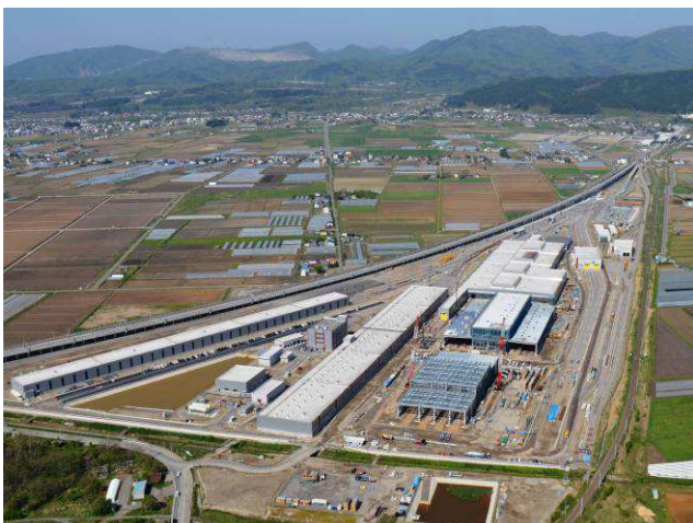
函館総合車両基地