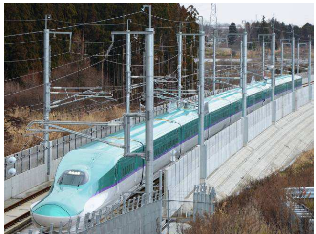
H5系車両 走行試験中