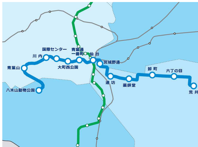
仙台市交通局資料より

また、当社が開発した導電鋼レール式剛体電車線が東西線全線に採用され、製造から施工までトータルな技術で当該事業に貢献しております。