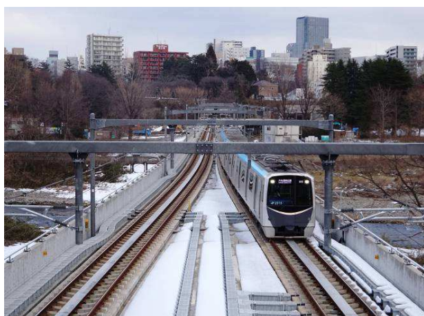
仙台市地下鉄東西線