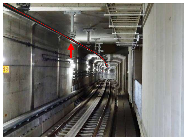
導電鋼レール式剛体電車線（製造）