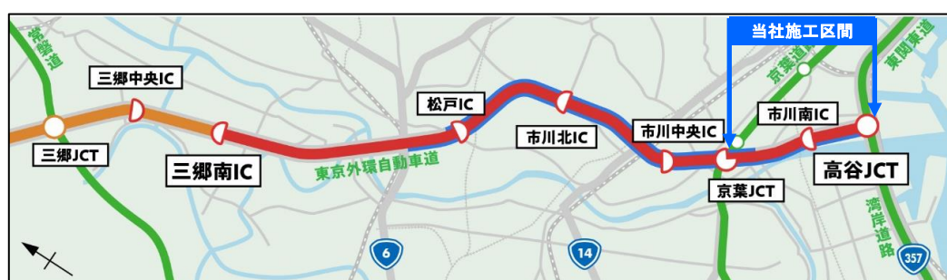
外環道千葉県区間路線図

今回の開通区間のうち当社は京葉JCT～高谷JCT間の照明設備工事を担当し、外環道千葉県区間の開通に貢献しました。