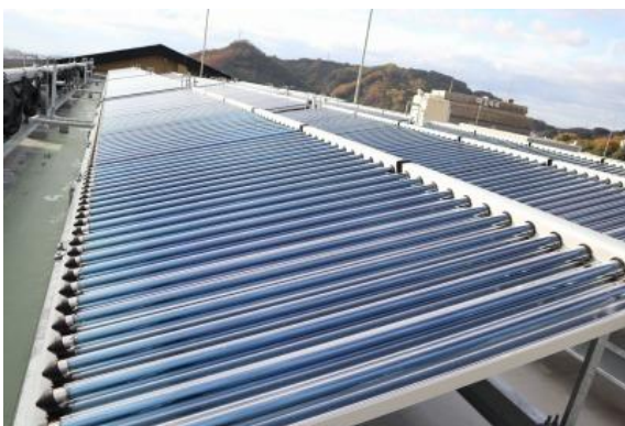
太陽熱集熱パネル