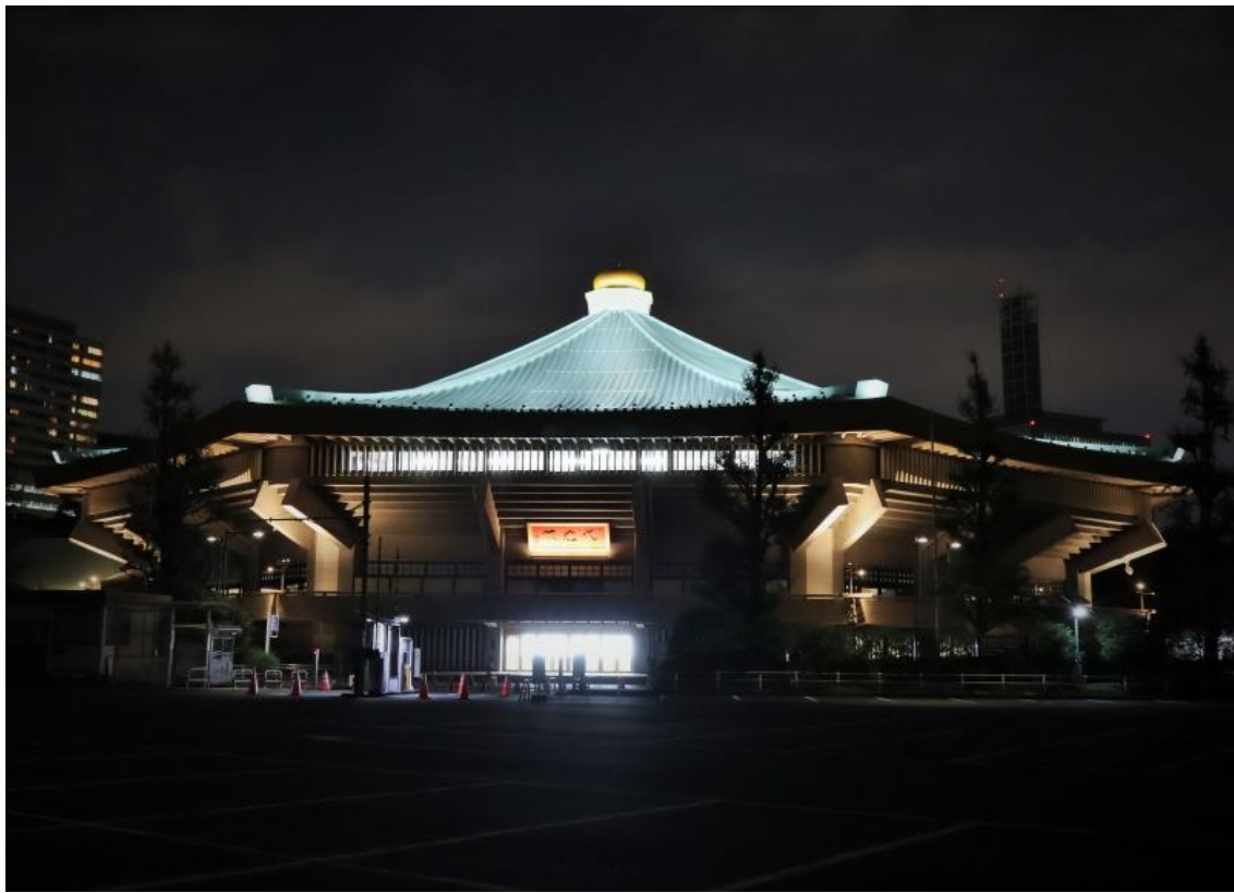
外観 ライトアップ