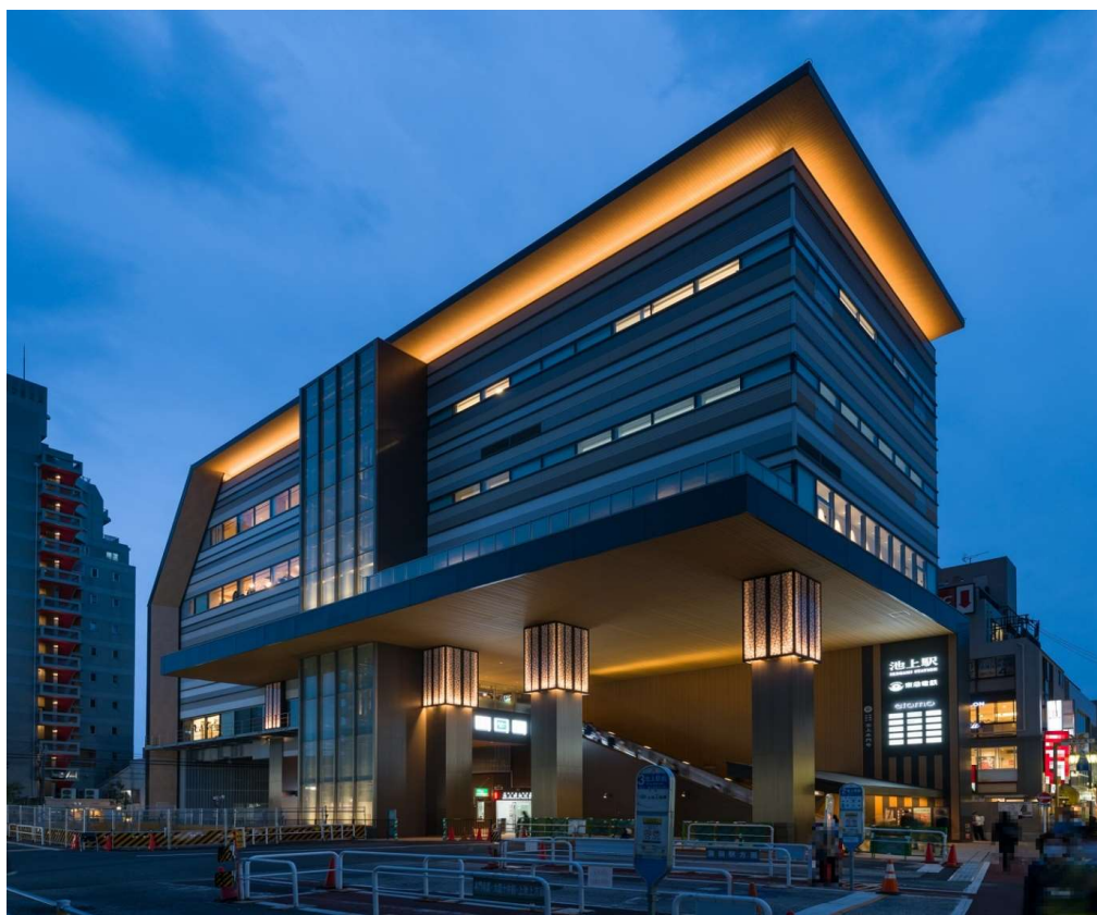
エトモ池上 外観 (ライトアップ)