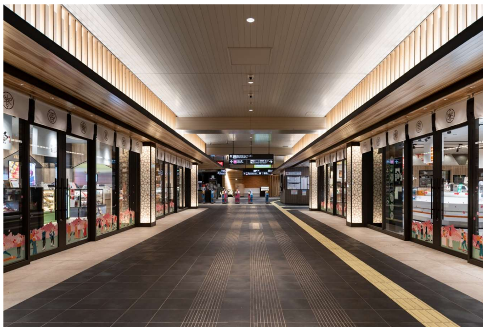
エトモ池上 2階コンコース