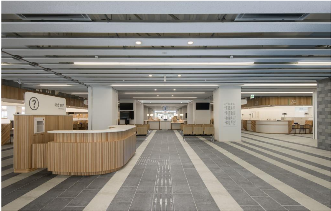
丸亀市市庁舎 1階 エントランスホール・総合案内