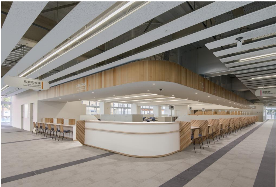
丸亀市市庁舎 1階 事務室