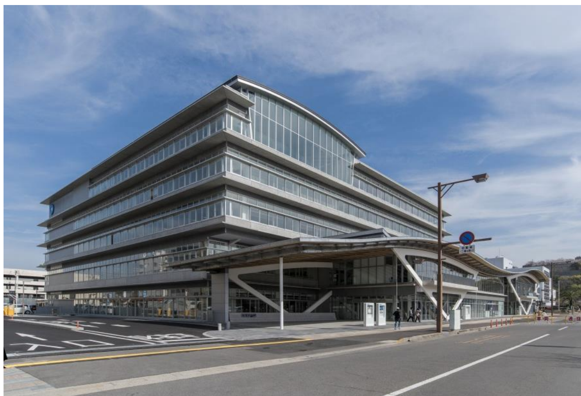
丸亀市市庁舎等複合施設 外観