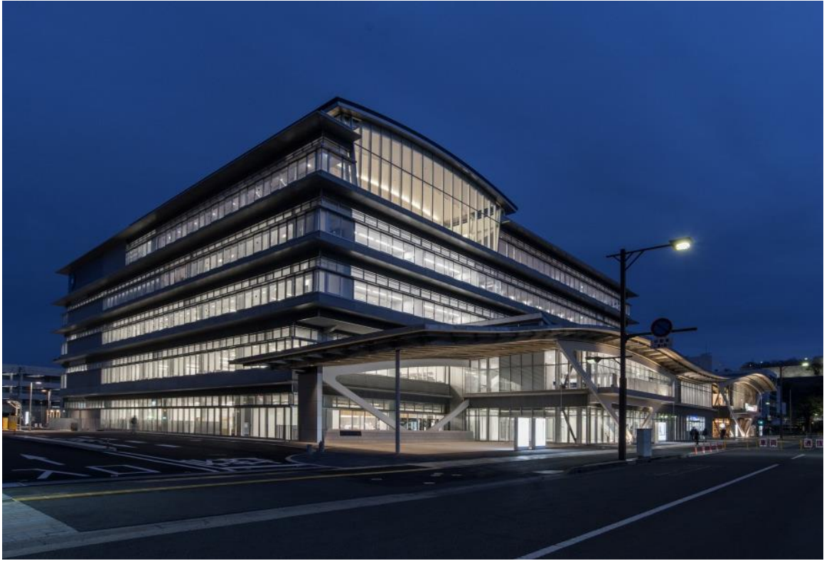
丸亀市市庁舎等複合施設 外観（ライトアップ）