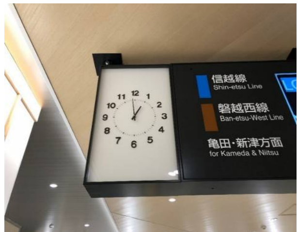
コンコースの時計