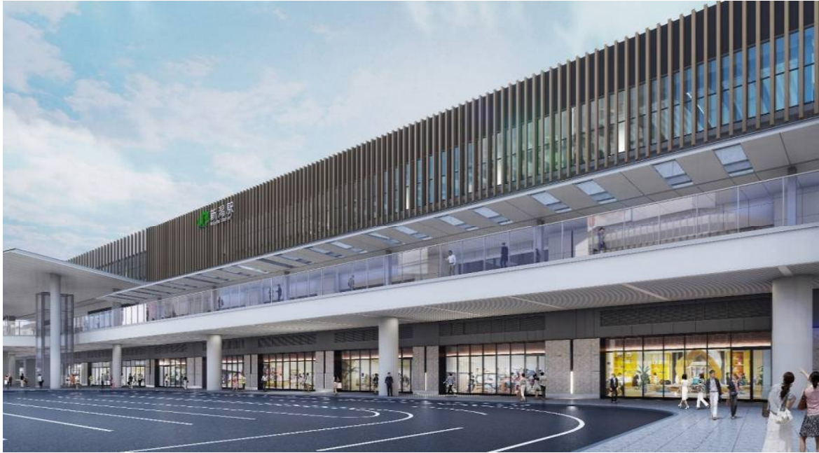
新潟駅高架下駅ビル 外観イメージパース