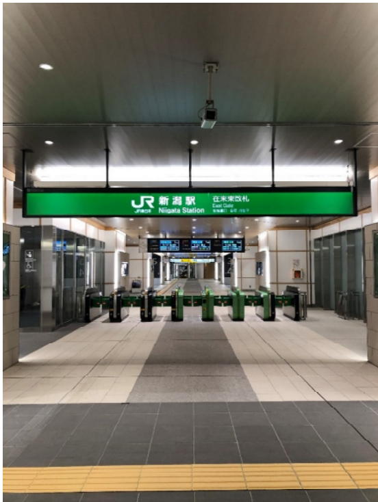
新設改札（在来東改札）