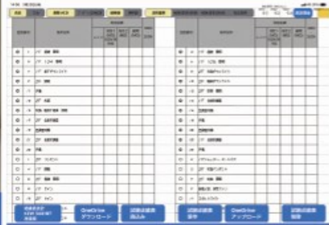
iPadアプリ画面 現場測定